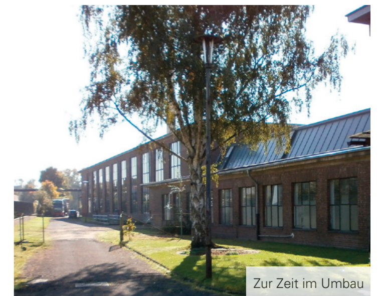
Zur Zeit im Umbau