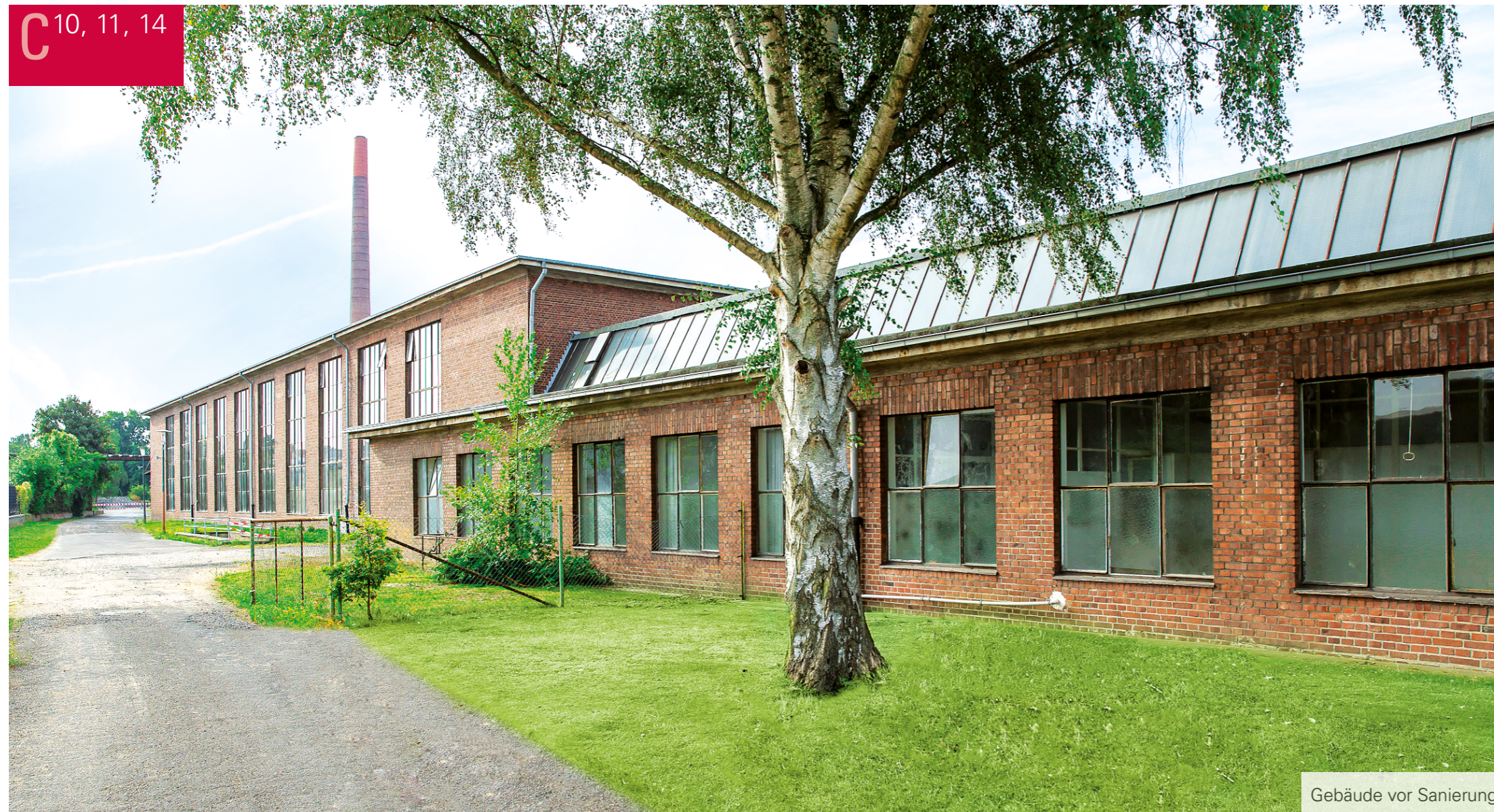
Gebäude vor Sanierung