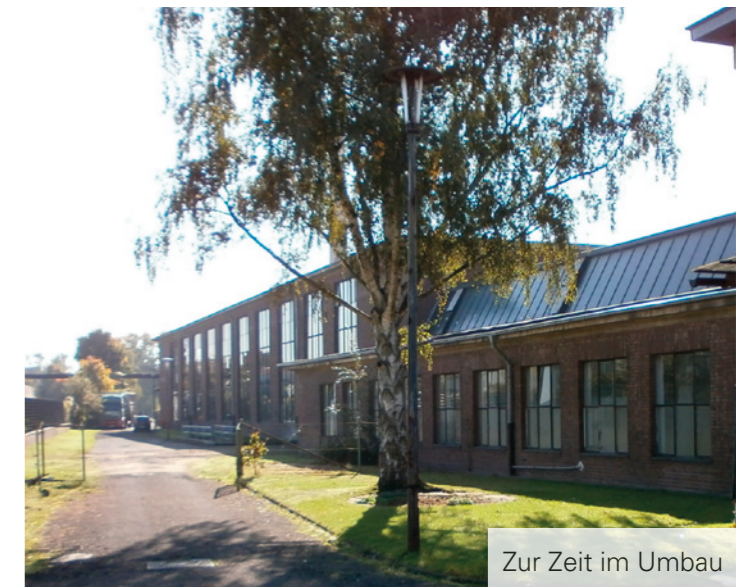
Zur Zeit im Umbau